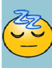
Are you sleeping?

Efectivamente, el sol brillando corresponde a la canción de: