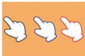
One little finger

Tienes las imágenes de mister chef, one Little finger y Are you sleeping, por lo que debes colocar con el nombre correcto a cada imagen. So, ready? ¿Estás listas o listos?