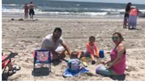
Foto familiar en la playa.

Esta foto es de un viaje que hice con mi familia a visitar a una tía, hermana de mi mamá que vive en Acapulco. La que aparece en la foto es mi tía, su marido y sus dos hijos. Si mis hijos y mis nietos miraran esta foto podría saber, que mi mamá tenía una hermana que tenía dos hijos, y que no toda mi familia vivía en la misma ciudad, porque yo vivo en la ciudad de México y mi tía en Guerrero.