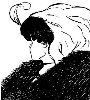
Dibujo de W.E. HILL en 1915

“Kelhtauakenanin, tu nak kelhaskini tin kin kakilhtiyalemani na uachi ka laktsintit uixinan”