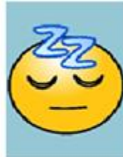
Are you sleeping?