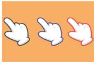
One little finger

Very good! The next activity is called: Time to memorize. / ¡Muy bien! La siguiente actividad se llama: Tiempo para memorizar.