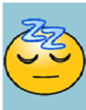
Are you sleeping?

Efectivamente, el sol brillando corresponde a la canción de: