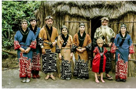
Pueblo Ainu de Japón.

Los Ainu han vivido durante miles de años en el norte de Japón, principalmente en la isla de Hokkaidō, y durante mucho tiempo se les presionó para abandonar sus costumbres e integrarse a la cultura japonesa mayoritaria. Solo recientemente, el gobierno japonés ha hecho esfuerzos para reconocer a la minoría Ainu como un pueblo indígena y respetar su forma de vida.