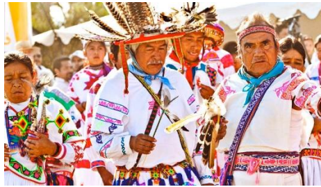
Pueblos indígenas de México.

Las minorías étnicas están formadas por personas que pertenecen al mismo pueblo o grupo étnico, por lo que comparten valores y visiones del mundo que los distinguen del resto de la población mayoritaria. Tal es el caso de los judíos que viven en países como Ecuador, México o en otros países diferentes de Israel.