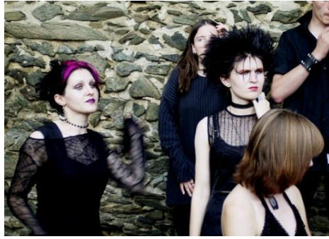
Grupos juveniles urbanos.

Ahora revisa algunas minorías culturales que son relevantes en el mundo.