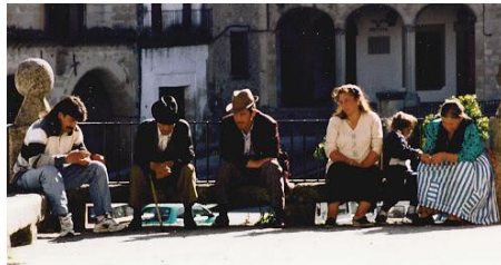
Gitanos en Europa.

Una de las minorías culturales más numerosas de Europa es la de los gitanos que, se cree, llegaron a ese continente desde India y Pakistán, a partir del siglo XV. Este grupo cultural ha sufrido persecuciones en más de un momento a lo largo de la historia, sobre todo en el siglo pasado, por lo que se han visto obligados a migrar, tanto dentro, como fuera de Europa.