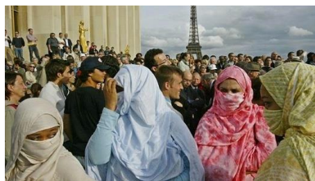
Musulmanes en Europa.

Las minorías religiosas están formadas por grupos que se distinguen por tener creencias y prácticas religiosas diferentes a las predominantes. Un ejemplo son los musulmanes que viven en Europa o los Estados Unidos de América o los católicos que residen en Japón.