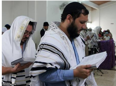
Judíos en Ecuador.

Las minorías étnicas están formadas por personas que pertenecen al mismo pueblo o grupo étnico, por lo que comparten valores y visiones del mundo que los distinguen del resto de la población mayoritaria. Tal es el caso de los judíos que viven en países como Ecuador, México o en otros países diferentes de Israel.