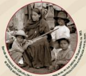
Grupo de niños en el Ejército Federal durante un descanso en un campamento de Sonora, ca. 1913. © 1983, por el Museo de la Cultura, el Museo de la Historia y el Museo de la Educación. Foto: El Jefe.

El general Francisco Villa tenía una gran preocupación por darle educación a las niñas y los niños. Dicen que cuando llegó a la Ciudad de México y se encontró con tantos infantes durmiendo en la calle ordenó que fueran llevados a Chihuahua para ser inscritos en la Escuela de Artes y Oficios. Incluso llegó a pensar en aprovechar los ratos libres para darle algún tipo de educación al gran número de menores que formaban parte de su ejército.