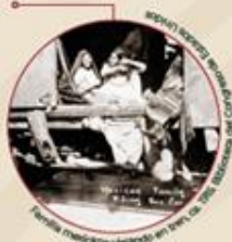
Mujer mexicana viajando en tren, ca. 1915.

No había tiempo para detenerse, los niños nacían sobre los trenes, en el campamento o incluso en medio de la batalla. Por el bien de todos había que continuar con la lucha. El rebozo de mamá era donde los más pequeños pasaban la mayor parte del día.