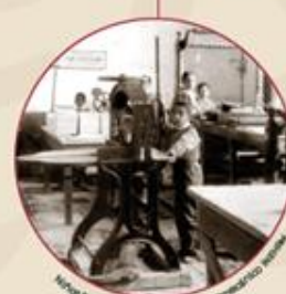
Niños trabajando en un taller. Fotomecánico anónimo.

“ A nadie le voy a prohibir que pelee por nuestra causa, no importa edad ni sexo ”