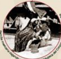
Mujer mexicana viajando en tren, ca. 1915.

En medio de la guerra, la violencia y la muerte estaban presentes todos los días, por lo que se volvieron cosas comunes. Pero, sin importar lo espantoso del paisaje que los rodeara, o de lo que pensarán los adultos, los niños nunca dejaron de ser niños realmente.