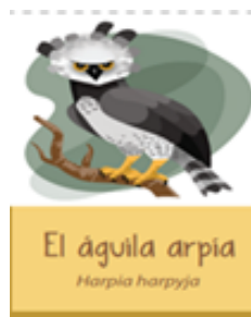
EL ÁGUILA ARPÍA Harpia harpyja

Esta ave, ¿Dónde vive? qué te parece si lees lo que el águila arpía tiene que decirte.