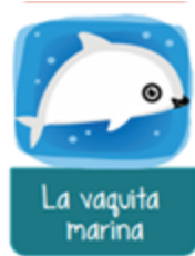
LA VAQUITA MARINA. Phocoena sinus

Observa a otro animal, es una vaquita marina, ¿La conoces? es un animal grande, lee sobre este animal.