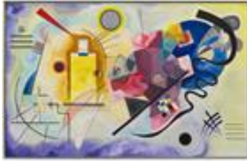
Vasili Kandinsky, "Amarillo, rojo y azul" [pintura] (1925), Libro de texto SEP. Libro de preescolar, Primer grado, Láminas didácticas 2020, pp. 21. Extraído de: https://libros.conaliteg.gob.mx/20/K1LAM.htm#page/21

En esta obra se pueden apreciar líneas rectas, curvas, círculos, más colores y figuras más detalladas como círculos, caras y objetos.