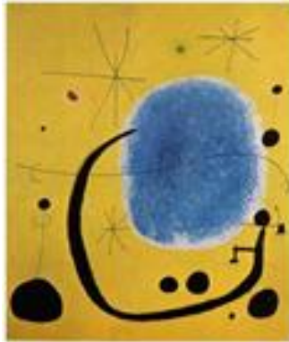
Joan Miró (1967) “El oro de azul” [pintura], pág. 45. Libro de texto SEP, artes tercer grado 2011.

Extraído de https://historico.conaliteg.gob.mx/H2011P3ED309.htm# sus pinturas.