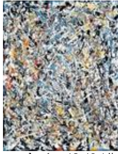
Jackson Pollock (1912-1952) "White Light" [pintura], pág. 48-49. Libro de texto SEP sexto grado 2011. Extraído de https://libros.conaliteg.gob.mx/P6EAA.htm#page/48

En la obra se pueden apreciar muchos colores fríos y trazos. Puede ser que provoque un poco de desorden y fuerza. Los colores que se puede apreciar son el negro, el blanco, amarillo, rojo y el café. Si aprecias bien, podrás identificar líneas rectas, paralelas y perpendiculares, así como algunos cuadriláteros.