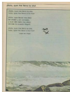
Libro de texto Lecturas Tercer grado 1982 pág. 93 ¡Hola, que me lleva la ola!

https://historico.conaliteg.gob.mx/H1982P3ES105.htm#page/42