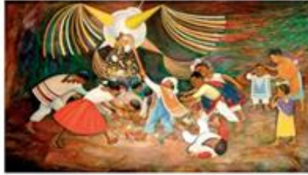
Diego Rivera (1886-1957), La piñata , 1953, temple sobre tela, 498 x 296 cm.

Observa la siguiente pintura, es de Diego Rivera y justamente se llama “La Piñata”, en ella se encuentra plasmada una de nuestras tradiciones.