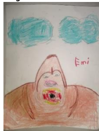
Dibujo de Emiliano.