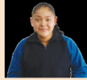
Imagen LTG de Telesecundaria. Formación Cívica y Ética. Tercer grado. Pág. 157

Algunas frases que yo he escuchado respecto a la equidad de género son una frase conocida pero cierta es, todos tenemos derecho a ser tratados por igual y la igualdad de género ha de ser una realidad vivida.