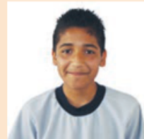
Imagen LTG de Telesecundaria. Formación Cívica y Ética. Tercer grado. Pág. 33

Yo opino que si no hubiera sido gracias a esas mujeres valientes por dar ese paso tan grande tal vez las demás mujeres no hubieran luchado por sus derechos, en países como el nuestro el machismo sigue estando presente por la ignorancia de la sociedad.