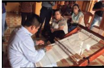
LTG de Telesecundaria. Geografía

En el caso de un hombre, si prefiere ser un bailarín, un gimnasta artístico o un tejedor de telar de cintura, ningún prejuicio debe impedirle que se dedique a lo que desea hacer en la vida.