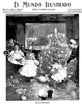
Un árbol de Navidad en la portada de “El Mundo Ilustrado”, 1901.

Observa la imagen. Esta portada es del periódico “El mundo ilustrado” de México en 1901.