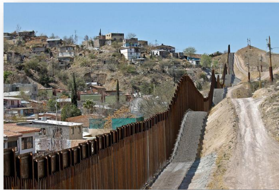
Muro Fronterizo Límite México- Estados Unidos

En referencia a las fronteras artificiales son aquellas que se han construido con muros, monumentos, puentes, etc. Tal como se muestra en la imagen en la frontera de México con Belice se ha construido un paso fronterizo, mientras que en el siguiente ejemplo se visualiza el muro fronterizo que divide México y Estados Unidos.