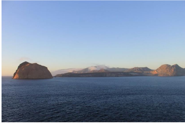
Islas Marías en Nayarit.