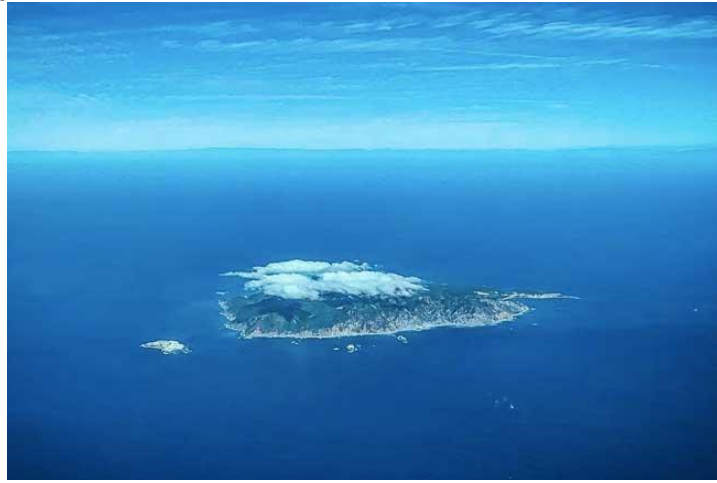
Isla Tiburón en Sonora.