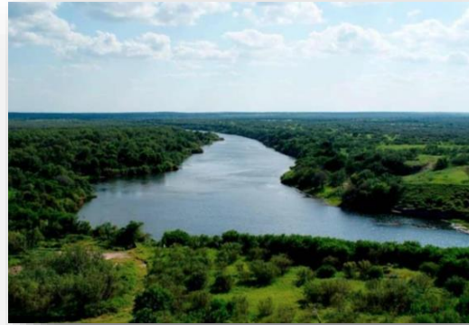
Río Bravo Límite México- Estados Unidos

Recuerda que las fronteras naturales son aquellas que separan territorios, por medio de cadenas montañosas, ríos, volcanes, etc. En la imagen puedes observar dos ejemplos de ello en México, el primero es el río Bravo que marca la frontera entre México y Estados Unidos, en el segundo ejemplo encontramos la frontera natural entre México y Guatemala en donde se localiza el volcán Tacaná.