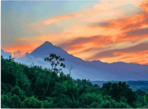
Volcán Tacaná Límite México- Guatemala