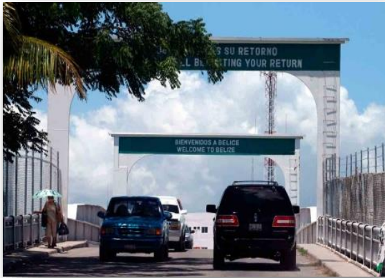
Paso Fronterizo Límite México- Belice