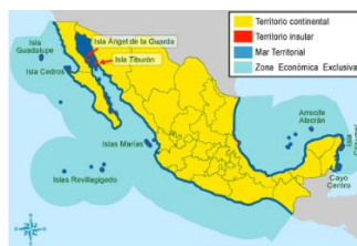
LIMITES Y FRONTERAS

Los componentes políticos se refieren a la forma en que los seres humanos nos organizamos administrativa y jurídicamente, a través de localidades, municipios y estados; así como a través de distintas formas de gobierno; por ejemplo: las monarquías y las democracias.