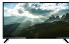
Tienda C: $3 746