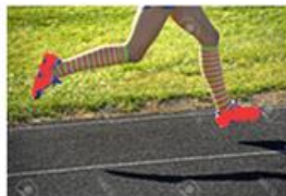
Corredor B: 1 859 metros

Como las cantidades tienen cuatro cifras, pues se comparó y las tres primeras cifras son iguales, así que la última es la que dice quién lleva más metros recorridos y va hasta adelante. Así que es el corredor B quien va adelante con 1 859 metros.