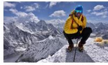
Alpinista A: 8 245 m