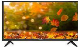
Tienda A: $3 467

¿Estás de acuerdo? correcto, el menor precio es la A) $3 467 . ¿Te fijaste que se siguieron varios pasos para llegar al precio menor? ¿Tú hiciste lo mismo o de qué otra forma comparaste los precios? Vamos al siguiente reto.