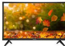
Tienda A: $3 467