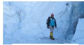
Alpinista C: 6 999 m