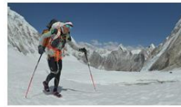
Alpinista D: 8 199 m

¿Listos? vamos a resolver para comparar resultados. ¿Nos ayudas?