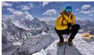
Alpinista A: 8 245 m

Al comparar las cantidades se observa que hay dos alpinistas que subieron una altura mayor, y por tanto coinciden en la primera cifra que comparé, y son A y D, así que se siguió a la siguiente cifra y ahí se identifica que el alpinista A tiene la cifra mayor, que es 2. Entonces él fue el alpinista que se llevó el premio por haber llegado más alto de ellos cuatro.