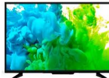
Tienda B: $3 674