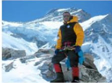
Alpinista B: 7 399 m