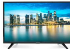
Tienda D: $3 476

Compararon su precio en 4 tiendas. En la tienda A) $3 467, en la B) $3 674, c) $3 746, y en la d) $3 476. ¿En qué tienda es la compra más económica?