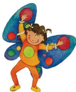
IMAGEN 3. Accesorios, antifaz, mascadas, diadema, zapatillas.