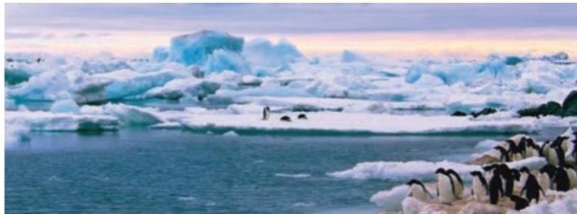
Figura 1.55 Toda la Antártida cuenta con clima EF, lo cual la convierte en uno de los territorios más inhóspitos de la Tierra.

En el clima EF de hielos perpetuos, la temperatura media del mes más cálido es inferior a cero grados Celsius; no existe ningún tipo de vegetación y lo podemos localizar como el clima de la Antártida, del interior de Groenlandia y de las mayores alturas del Himalaya.