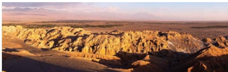
Figura 1.54 El desierto de Atacama, en el norte de Chile, cuenta con un clima BW y es considerado el más árido del mundo.

El clima BW, seco o desértico. La evaporación es mayor a la precipitación, las temperaturas son cálidas o muy cálidas en el día y frías por la noche, y en invierno es cercana a los cero grados. En verano se han registrado las máximas del planeta. Este clima se presenta en las franjas subtropicales de ambos hemisferios, desierto del suroeste de Estados Unidos, Sahara, desierto de la península arábiga, costa del Perú y norte de Chile. Desierto de Namibia y desiertos de Australia.