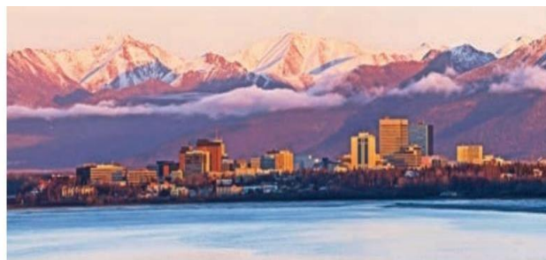
Figura 1.51 Alaska se caracteriza por su clima frío con lluvias todo el año. En la foto se muestra la ciudad de Anchorage.

Df y Dw, son climas fríos con lluvias todo el año o lluvias en verano. Presentan veranos frescos e inviernos muy fríos y con nieve, la vegetación predominante es la taiga o el bosque de coníferas. Su localización corresponde entre los 50 y 60 grados de latitud norte, en algunos lugares hasta los 70 grados, al interior de Canadá y Alaska, Norte de Europa y gran parte de Siberia entre el clima estepario frío y la tundra.