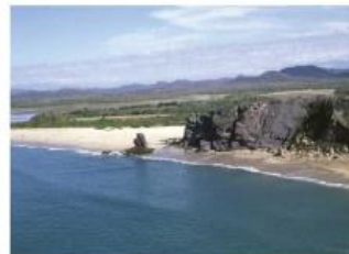
Costa de Mazatlán.

Libro de texto mi entidad, Sinaloa https://libros.conalleg.gob.mx/P32N