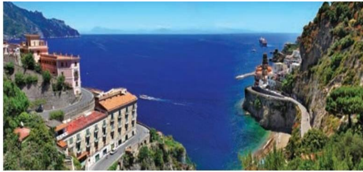
Figura 1.50 El clima Cs predomina en los países mediterráneos de Europa. En la foto, la costa de Amalfi en Salerno, Italia.

La clasificación, vegetación y distribución de los climas fríos es la siguiente: