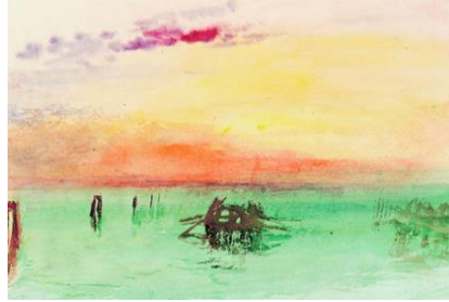
Joseph Mallord William Turner, Venice: Mirando a través de la laguna al atardecer, 1840

Puedes diferenciar ahora que la música es mucho más alegre y que incluso invita a moverte, quiere decir que está cargada de energía, de vitalidad y por tanto la puedes representar con colores cálidos a través de una imagen como la siguiente.