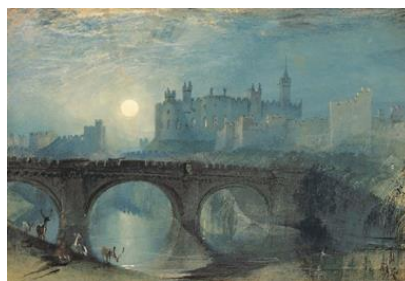
Joseph Mallord William Turner, Castillo de Alnwick, Northumberland, 1829. Acuarela sobre papel, 28, 3 x 48,3 cm

¿Qué te imaginas cuando escuchas esta melodía? Para algunos tranquilidad, calma, y entonces puedes iluminar un paisaje combinando colores fríos, tal como esta pintura del genial Turner, pintor inglés del siglo XIX: