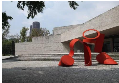
Entrada principal del museo “Tamayo”

Saca del baúl del arte la imagen de la entrada principal del Museo Tamayo.