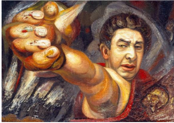
David Alfaro Siqueiros, 'Autorretrato (El coronelazo)', 1945.