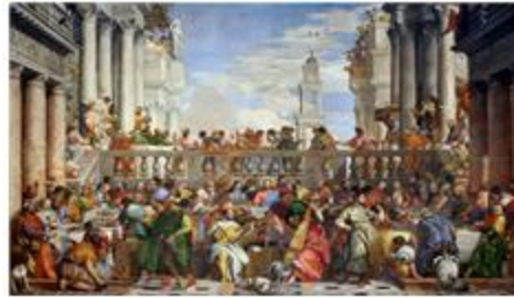
Las Bodas de Caná de Veronés.