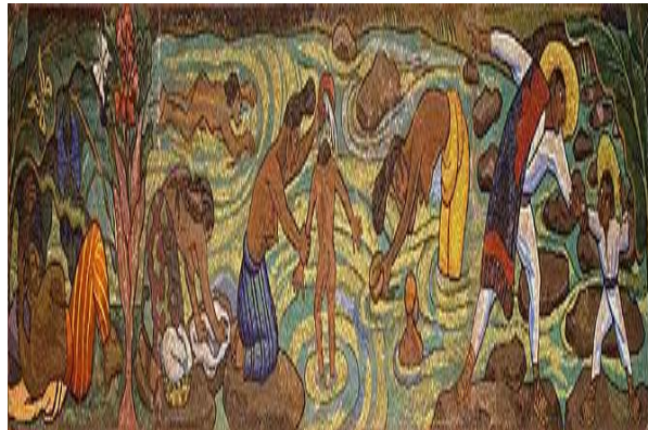
Diego Rivera, Río Juchitán 1956