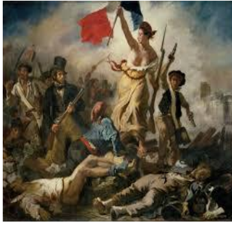
La Libertad Guiando al Pueblo de Delacroix.