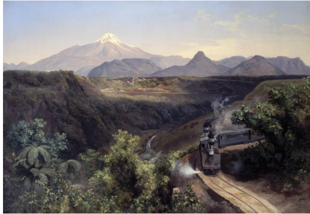
José María Velasco, Cañada de Metlac, 1893.

Imágenes extraídas de http://www.munal.mx/es/exposiciones