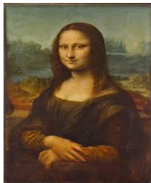
La Gioconda de Leonardo da Vinci.

Mounstrilio: Sí, el Museo del Louvre es toda una obra de arte desde la arquitectura, recuerdo que cuando lo visité había mucha gente haciendo fila para observar sus más preciadas obras artísticas tal como: