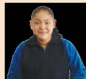
Imagen LTG de Telesecundaria. Formación Cívica y Ética. Tercer grado. Pág. 157

Yo pienso que como tal la equidad de genero es correcta y está bien empleada, pero algunas personas abusan de sus derechos en la equidad de género, pidiendo más derechos de los cuales ya tienen, exigiendo empleos cómodos y no de carga.