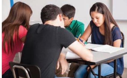
Primer grado. Pág. 259

Con base en lo que acabo de explicar, ¿consideras que en tu familia o en las relaciones con tus amigas y amigos puedes promover la equidad de género? Piensa de qué manera y anota algunas ideas al respecto.