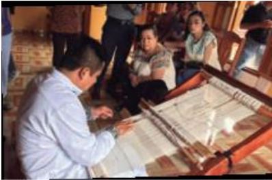
LTG de Telesecundaria. Geografía

En el caso de un hombre, si prefiere ser un bailarín, un gimnasta artístico o un tejedor de telar de cintura, ningún prejuicio debe impedirle que se dedique a lo que desea hacer en la vida.