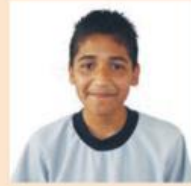
Imagen LTG de Telesecundaria. Formación Cívica y Ética. Tercer grado. Pág. 33

Algunas de las frases que he escuchado respecto de la equidad de género son que hombres y mujeres tenemos derecho a los mismos trabajos y sueldos.