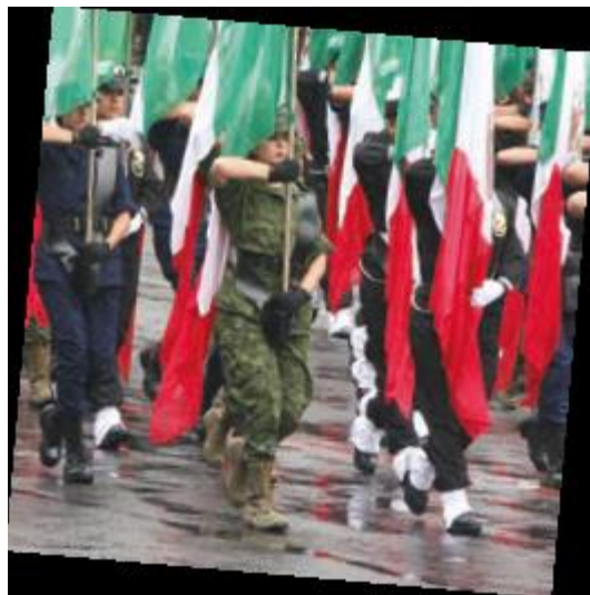
LTC de Telesecundaria. Geografía. Primer grado. Pág. 117

Debido a las situaciones que te he comentado al principio de la sesión, las que se mostraron en el video y las que tú viven o conoces, es necesario reconocer qué es la equidad de género y ejercerla en nuestras relaciones cotidianas, de modo que el trato entre niñas y niños, las y los adolescentes, así como entre las personas adultas deje de ser desigual, incluso discriminatorio; esto con la finalidad de que cada persona tenga las condiciones que necesita para desarrollarse en todos los aspectos de su vida.