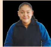
Imagen LTG de Telesecundaria. Formación Cívica y Ética. Tercer grado. Pág. 157

Algunas frases que yo he escuchado respecto a la equidad de género son una frase conocida pero cierta es, todos tenemos derecho a ser tratados por igual y la igualdad de género ha de ser una realidad vivida.