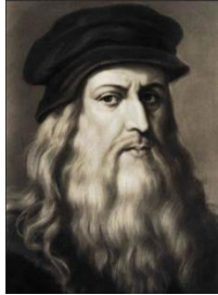
Leonardo da Vinci hecho entre 1512 y 1515

Para conocer y tener una idea del espacio personal vas a observar unas imágenes inspiradas en el dibujo de el “Hombre del Vitruvio” del gran artista “Leonardo Da Vinci”; pintor, inventor y científico, entre otras cosas.