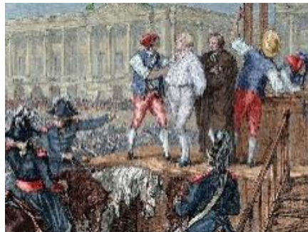
EJECUCIÓN DE LUIS XVI

Para demostrar la extinción de la monarquía, la Convención Nacional ejecutó al rey Luis XVI en enero de 1793 y meses más tarde a la reina María Antonieta. La Asamblea se convierte en un caos, ya que se ejerció el poder al margen de la normativa constitucional con la justificación de que la revolución estaba en peligro.