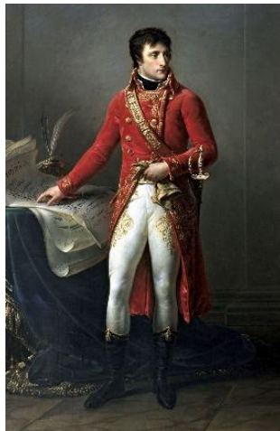
NAPOLEÓN BONAPARTE, CONSÚL

Esto genera un desánimo de la población por la indiferencia del nuevo gobierno, además de que en el Directorio se empezó a formar corrupción percibida por el pueblo y la alta burguesía, es así como surge de la milicia la figura de Napoleón Bonaparte, un gran estratega militar que el 9 de noviembre de 1799 llevó a cabo un exitoso golpe de Estado que derrocó al Directorio y se nombró cónsul.