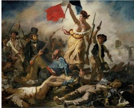
LA LIBERTAD GUIANDO AL PUEBLO

https://commons.wikimedia.org/wiki/File:Eug%C3%A9ne_Delacroix_-_Le_28_Juillet_-_La_Libert%C3%A9_guidant_le_peuple.jpg