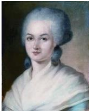
OLYMPE DE GOUGES

ejercían los varones en la Declaración de Derechos del Hombre y del Ciudadano emitida en 1789, también debía reconocer los derechos de las Mujeres ya que ellas también habían aportado mucho durante la primera etapa de la revolución, pero la ley no lo permitía, así que criticó la pena de muerte y defendió una monarquía moderada, y fue llevada a la guillotina. La Declaración de los Derechos de la Mujer y la Ciudadana sentó un precedente para el movimiento femenino en Europa y el mundo, efecto que hasta nuestros días sigue en pie persiguiendo el respeto y la equidad de género.