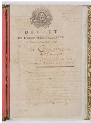
CONSTITUCIÓN DE 1791

El 14 de septiembre de 1791 se promulgó una nueva constitución que suprimió los privilegios de la nobleza y el clero; decretó la libertad de expresión, prensa y creencia, e instituyó la monarquía constitucional. Además se convocó a las primeras elecciones libres en Francia para elegir una nueva Asamblea Nacional.