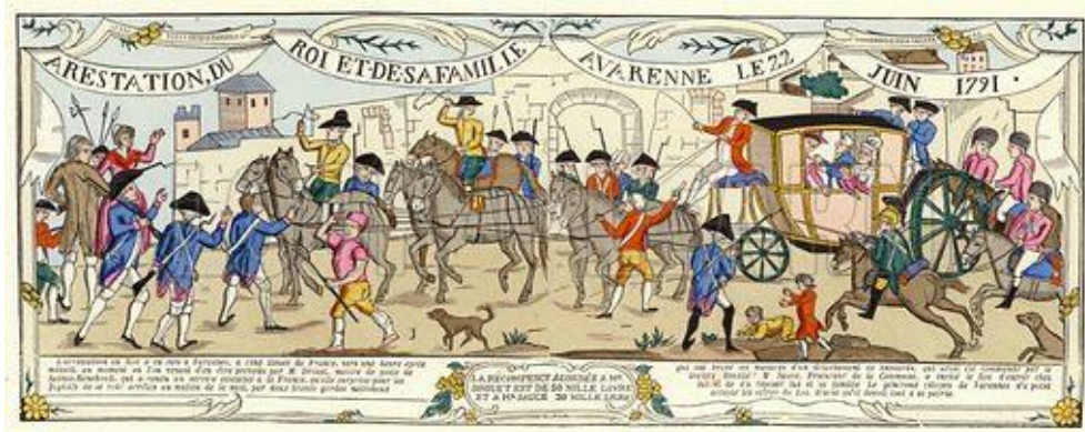
El Rey Luis XVI huyendo con su familia junio de 1791

desconocen la autoridad del rey por tal acto y le obligan a jurar la Constitución, con una nueva administración para el estado, para las finanzas públicas y para la impartición de justicia.