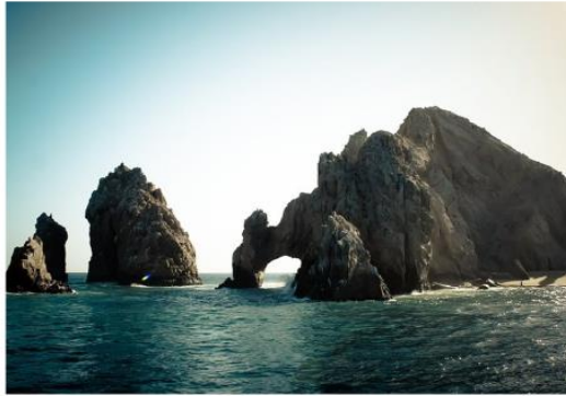
Erosión eólica y marina en Cabo San Lucas, Baja California Sur

En este sentido, pero en el extremo opuesto del país, es decir en el sureste, está la Península de Yucatán, la cual es una planicie que se debe al levantamiento tectónico, es de origen reciente y tiene una elevación máxima de 200 metros sobre el nivel del mar; no existen formaciones montañosas, salvo por algunos lomeríos en la parte central. Su relieve, relativamente plano, y su geología favorecen la formación de cenotes, los cuales son pozos de agua subterránea y antiguas cavernas formadas en el interior de la Tierra, debido a la filtración del agua de lluvia y erosión de la roca caliza, o erosión kárstica, como también se le conoce.