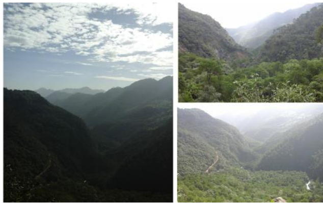
Sierra Madre Oriental

Por otro lado, está la Sierra Madre Occidental que atraviesa los estados de Chihuahua, Sonora, Sinaloa, Durango, Zacatecas, Nayarit y Jalisco, por lo que es la más extensa del país; en ella predominan formaciones de origen volcánico, las cuales alcanzan los 3,000 metros sobre el nivel del mar.