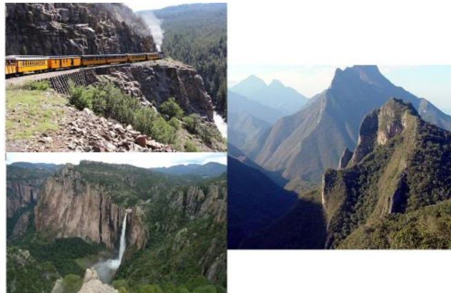
Sierra Madre Occidental

La Sierra Madre Occidental forma parte de la Cuenca del Pacífico, que recorre toda la porción occidental del continente americano, desde Alaska hasta la Patagonia argentina.