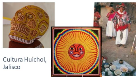
Cultura Huichol, Jalisco

En Jalisco viven grupos étnicos descendientes de los primeros pobladores; de entre los que destacan: los huicholes, purépechas, mixtecos, zapotecos, otomíes, huastecos y coras.