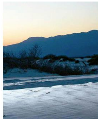
Dunas de yeso, Cuatro Ciénegas, Coahuila

Estas dunas de yeso son un recurso turístico muy importante debido a que se observan como nieve en medio del desierto; sin embargo, también hay que saber que esto se debe a la cristalización del calcio, que ocurrió en el fondo del mar de Tetis, desecado hace millones de años.