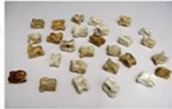
Astrágalos o tabas

tabas. Estas piezas las ta consideradas como las prec