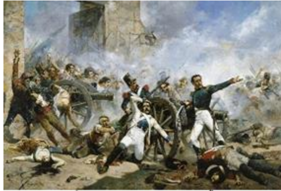
INVASIÓN FRANCESA A ESPAÑA. 1808