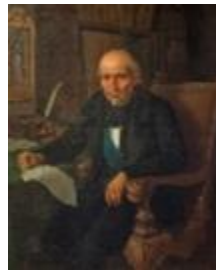
MIGUEL HIDALGO 4