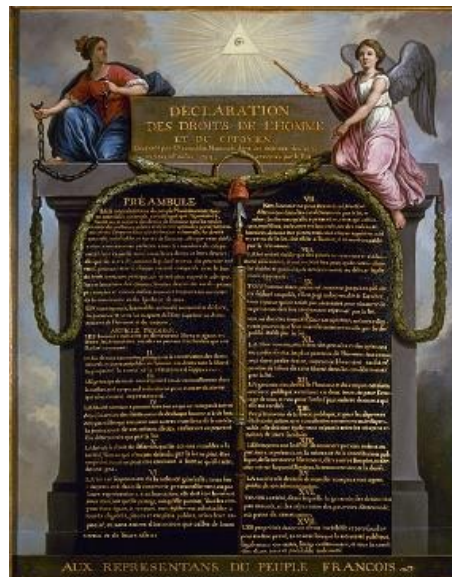
DECLARACIÓN DE LOS DERECHOS DEL HOMBRE Y DEL CIUDADANO. 1789

Además, consiguió proclamar la Declaración de los Derechos del Hombre y del Ciudadano de 1789, en la que se estipulaba que los hombres nacen libres e iguales en derechos, y la libertad de opinión y prensa.