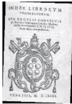
ÍNDICE DE LIBROS PROHIBIDOS

https://libros.conaliteg.gob.mx/20/TPIIA.htm?#page/62