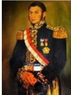
JOSÉ DE SAN MARTÍN 2