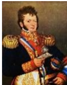
BERNARDO DE O´HIGGINS 3