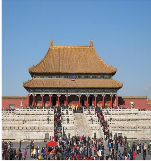
La ciudad prohibida. Pekín.

Observa la siguiente pintura: “La ciudad perdida”.