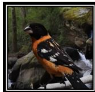
Pico grueso tigrillo

Lee las opiniones de algunas niñas y niños: