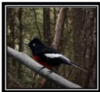
Chipe ala blanca

Las siguientes las imágenes de animales quizá te sean desconocidos. Observa bien en sus nombres, cómo suenan y cómo se escriben, y recuerda palabras de objetos, de cosas, que inicien igual.