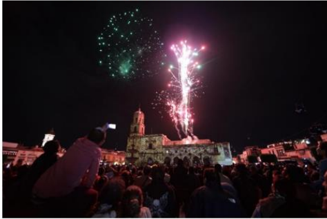
Centro Histórico de Morelia