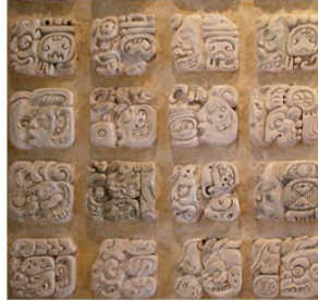
Signos de escritura maya.

Así mismo, los mayas crearon un avanzado sistema de escritura que utilizaban para registrar las hazañas guerreras de los gobernantes, para contar el tiempo y con diversos propósitos religiosos, tenían una manera de ver la belleza muy, muy diferente a la de nosotros.