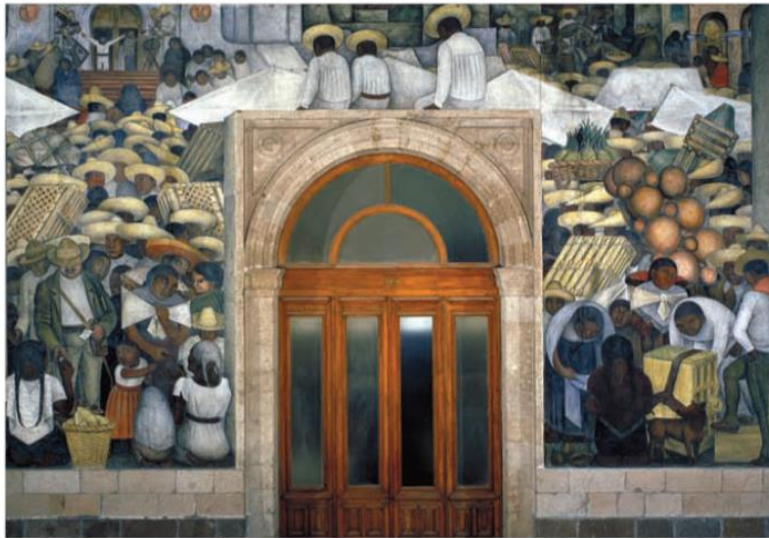
Diego Rivera, El tianguis (1923-1924), pintura al fresco, panel izquierdo: 459 X 240 cm; sobrepuerta: 109 x 302 cm; panel derecho: 460 x 237 cm.

Observa el mural titulado, “El tianguis” del pintor Diego Rivera.