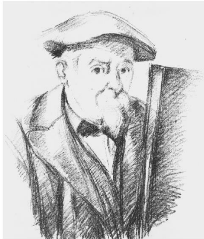
Paul Cézanne (1839-1906), Autorretrato en caballete , ca. 1900, litografía, 47 x 34.5 cm.

Observa la litografía del pintor Paul Cézanne, considerado el padre de la pintura moderna.