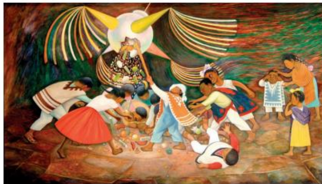
Diego Rivera (1886-1957), La piñata , 1953, temple sobre tela, 498 x 296 cm.

1. La obra titulada “La piñata” del pintor Diego Rivera.