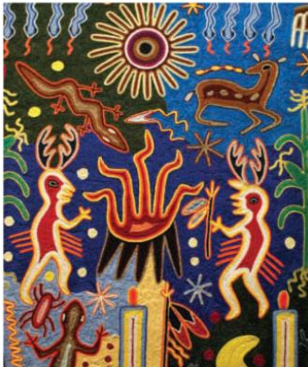
Anónimo, cuadro huichol (2008), estambre sobre madera y cera de Campeche, Museo Nacional de Antropología e Historia.

Anónimo, (2008) “Arte Huichol”, pág. 12 libro de la SEP, tercer grado 2011. Extraído de https://historico.conaliteg.gob.mx/H2011P3ED309.htm#page/13