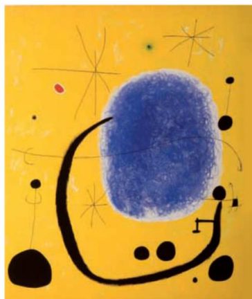
Joan Miró, El oro del azul (1967), acrílico sobre tela, 205 x 173 cm.

Observa la siguiente pintura de Joan Miró, “El oro de azul”.