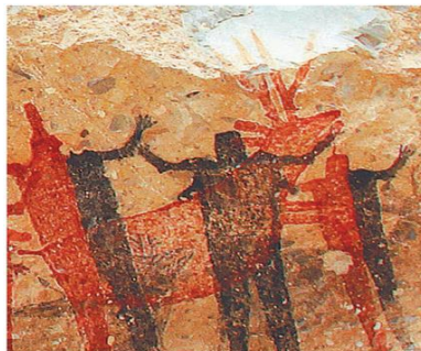
Pinturas rupestres en la llamada Cueva Pintada. Tienen una antigüedad aproximada de 7 500 años. Sierra de San Francisco, Baja California Sur.

En la siguiente imagen, se presenta una pintura rupestre que tiene una antigüedad aproximada de 7,500 años y se encuentra en la llamada Cueva Pintada, en San Francisco, Baja California Sur.