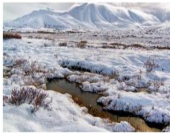
Alpes Venezolanos. Pradera de alta montaña