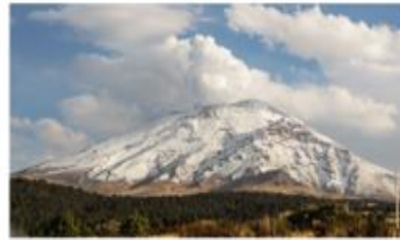
Relieve montañoso Iztaccihuatl, México.

Grado de aislamiento. Algunas islas y zonas montañosas que están aisladas de otras tierras desarrollan más fauna y flora endémica.