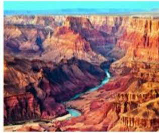
Meseta del Colorado, Arizona, Estados Unidos.