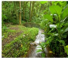
Selva tropical en el Pacífico central, Costa Rica

Como resultado de la ubicación geográfica y de sus diferentes tipos de relieve, Costa Rica tiene climas secos como las tierras bajas en la provincia de Guanacaste, conocida por sus playas y por su bosque tropical seco que albergan una importante diversidad de flora y fauna, como el árbol de Guanacaste, el árbol Cortés amarillo, la iguana negra, la urraca copetona y los monos aulladores.