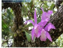
Orquídeas en el bosque