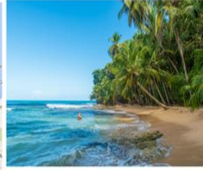
Gandoca, Costa Rica