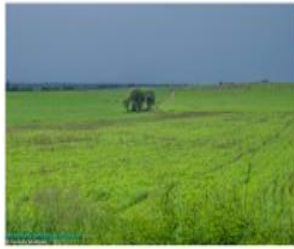
Llanura de Catamarca, Argentina.