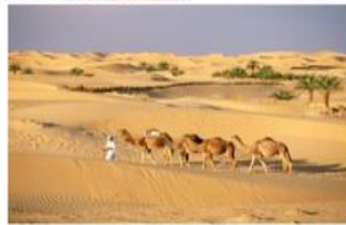
Rub al-Jali, Arabia Saudita. Desierto

Ahora daremos lectura al correo electrónico de la página 52 de tu libro de texto de Geografía.