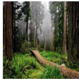
Sierra Madre Oriental, México. Bosque