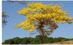
Árbol de cortés