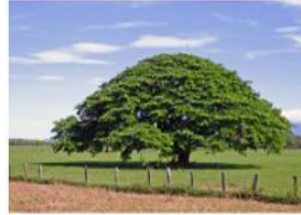
Árbol de Guacanáste