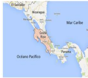
Ubicación geográfica de Costa Rica