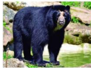
Oso de anteojos

Pero, ¿A qué crees que se deba que esta cantidad de especies pueda variar entre un país y otro?