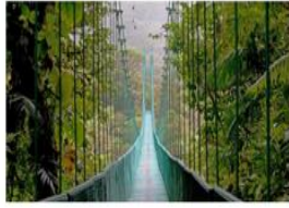
Reserva biológica de Monteverde, Costa Rica