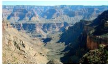
Depresiones del Gran Cañón, Estados Unidos.