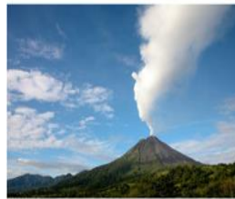
Volcán el Arenal, Costa Rica