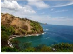
Playas de Guacanáste, Costa Rica