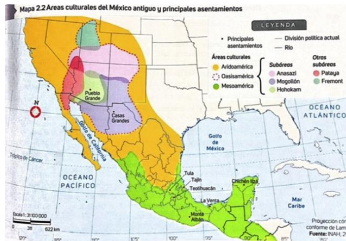
Principales asentamientos de Oasisamérica: Anasazi, Hohokam, Mogollón, Pataya y Fremont.

Ahora profundizarás en la cultura Mogollón para ejemplificar el esplendor que alcanzaron las culturas de Oasisamérica y también porque dentro de esta población, se desarrolló uno de los complejos arquitectónicos más impresionantes de esta superárea cultural: Paquimé o Casas Grandes.