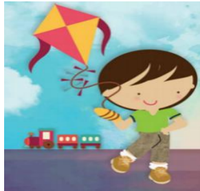
Derecho al juego y al descanso.

Como hemos visto las niñas y los niños tienen muchos derechos que los protegen. Te voy a comentar algunos rápidamente, pero eso no quiere decir que sean más importantes unos que otros, todos los derechos son iguales en importancia, y todos deben ejercerse y garantizarse por parte del Estado.