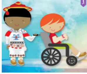
Derecho a no ser discriminado.