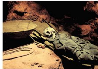
Ejemplo de un enterramiento encontrado en la cueva de La Candelaria, Coahuila.

Los habitantes de Aridoamérica tuvieron que sobrevivir cazando conejos, gato montés, pumas y venados; se alimentaban de la flora como los cactus y los nopales.