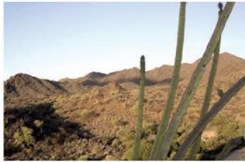
Los habitantes de Aridoamérica tuvieron que sobrevivir en este tipo de paisajes, donde cazaban conejos y venados.

Estas condiciones influyeron para que las y los habitantes de esa región fueran grupos seminómadas pues debían buscar constantemente comida, por esta razón no lograron construir pueblos o ciudades. Algunos consideran que el desarrollo cultural de estos pueblos fue muy básico.