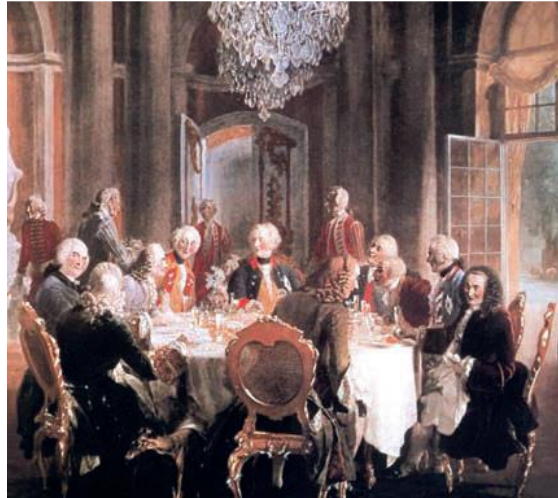
Corte del rey Federico II de Prusia. PÁGINA 31, LTG. HISTORIA 1 TELESECUNDARIA.

Muchos monarcas sintieron amenazada su posición tras el surgimiento de las ideas ilustradas y su difusión, por lo que llevaron a sus cortes a pensadores ilustrados para aplicar algunas de sus ideas en el ejercicio del poder con el único propósito de preservarlo; algunos monarcas europeos modernizaron sus Estados para enfrentar la competencia por el poder económico y político.