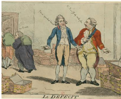
Luis XVI muestra los cofres del reino vacíos. El Déficit, Isaac Cruikshank (1788). LTG Historia 1. Telesecundaria.

Este proceso fue conocido como despotismo ilustrado, el cual se adoptó en la segunda mitad del siglo XVIII como forma de gobierno para centralizar el poder en el Estado, administrar la justicia, preparar al ejército, modernizar la administración e implementar reformas para mejorar las condiciones de vida de sus gobernados. El Estado se podía fortalecer con la educación, la cultura y la tolerancia religiosa, siempre y cuando ésta no se opusiera a la ciencia y al progreso tecnológico.