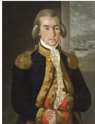
Vicente de Emparan

En Venezuela, Vicente de Emparan se levantó en armas en abril de 1810; en la Nueva España se inició con Miguel Hidalgo en septiembre del mismo año; y en Chile, Bernardo O´Higgins emprendió la lucha desde 1813; cada uno influenciado por las ideas liberales e ilustradas, por ejemplo, el texto “Proclama a la Nación Americana” emitida por Miguel Hidalgo en Guadalajara el 21 de noviembre de 1810” que leíste al inicio.