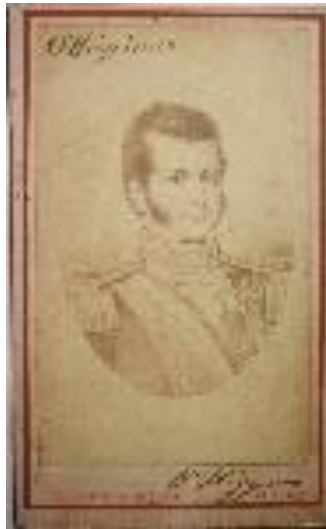
Fotografía Bernardo O 'Higgins Carta De Vista héroe chileno Foto Richardstonebay.com" by Carlos Andrés Gamero Esparza (leondeurgel) is licensed under CC BY-NC-ND 2.0.

Fuente: https://creativecommons.org/licenses/by-nc-nd/2.0/