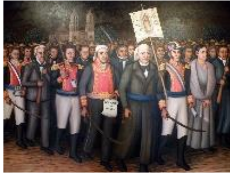
"Miguel Hidalgo, Vicente Guerrero, José María Morelos y Pavón, entre otros."

Fuente: https://creativecommons.org/licenses/by-sa/2.0/