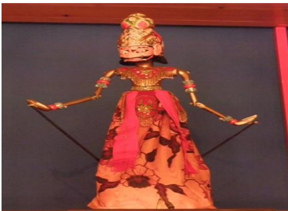
Títere de Varilla.