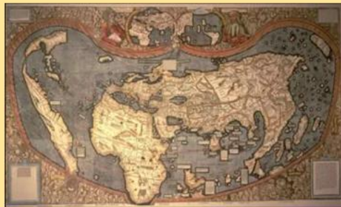
Martin Waldseemüller fue el creador del primer mapamundi. 1507

Tal vez puedas pensar que los mapas que conoces, siempre han estado ahí, pero tienen una historia y, por lo tanto, cada nueva representación es más precisa. Los mapas se perfeccionan y discuten, como cualquier conocimiento humano. Por ejemplo, el sur no necesariamente tiene que estar en la parte inferior, puesto que en el universo no existen esas coordenadas, además,