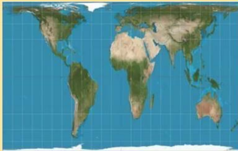
Mapa de Arno Peters. 1974