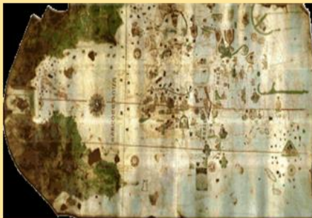
Juan de la Cosa. 1500

Así, la evolución de los mapas pasa por el nivel de detalle, contenido y precisión que, con el tiempo, fueron adquiriendo. En el siglo XVI se incorporaron a la historia de los mapas las proyecciones cartográficas de Mercator y Ortelius, las cuales consisten en el procedimiento geométrico que se utiliza para desdoblarse la forma esférica de la Tierra y convertirla en un plano.