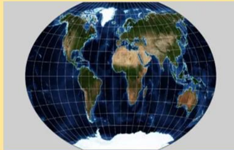
National Geographic. 1998. Es el más utilizado en la actualidad.

En la actualidad, los mapas se elaboran a partir de la aplicación de distintas fuentes de información y tecnologías, como las triangulaciones GPS, las imágenes de satélite y los Sistemas de Información Geográfica.