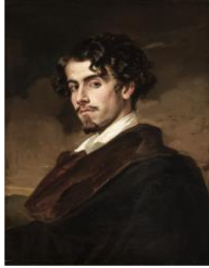
G. Adolfo Bécquer "Rimas"