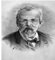
Guillermo Prieto ▪ Poemas ▪ Memorias de mis tiempos