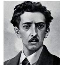
Manuel Acuña ▪ "Hojas Secas"

Estos escritores reflejan en su obra el contexto social e histórico en el que vivieron.