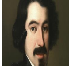
José de Espronceda "La canción del pirata"