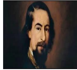
José Zorrilla "Don Juan Tenorio"