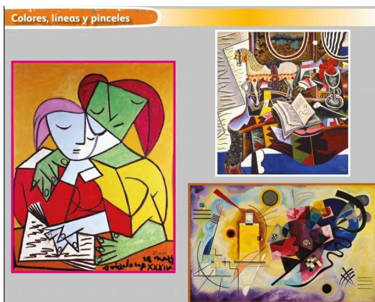
Lámina “Colores, líneas y pinceles” (Preescolar láminas didácticas primero 2020-2021, SEP)

Cualquier persona puede representar su mundo a través de los colores, las formas y muchas cosas más que conocerás en las siguientes sesiones. Observa la siguiente imagen que tal vez recuerdes como uno de los materiales de Preescolar: