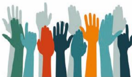
FCYE. 1ER GRADO. P. 178

Es interesante es saber a qué se refiere y distinguir la igualdad ante la ley y poder ejercer ese derecho en la sociedad. Decir que somos iguales no significa que todas y todos somos idénticos o que tenemos los mismos gustos, sino que tenemos el mismo valor como personas y, por lo tanto, debemos tener iguales oportunidades para desarrollarnos integralmente. Por ejemplo: Podemos observar una caja de colores; todos son de diferentes tonalidades, algunos muy parecidos, pero en esa diferencia cada color cumple su función cuando con ellos hacemos un hermoso y colorido dibujo.