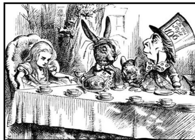
Alicia en el país de las maravillas