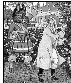
La bella y la bestia