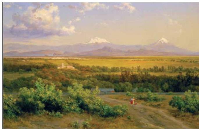
Valle de México

Y, por último, observa la pintura titulada Valle de México de José María Velasco realizada en 1900