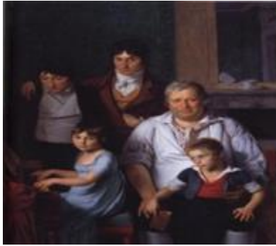
Diputado de la Convención Michel Gérard y su familia