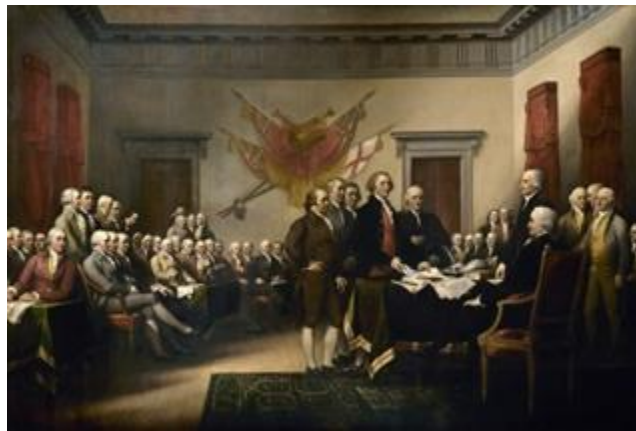
Declaración de independencia

La burguesía tuvo una importante participación en los movimientos revolucionarios que se gestaron entre los siglos XVIII y XIX, un claro ejemplo lo encontramos en los pensadores liberales que promovieron la independencia de las Trece Colonias de Norteamérica. Por ejemplo Benjamín Franklin, quien se convirtió en uno de los ideólogos del movimiento de independencia de los Estados Unidos de América. Proceso donde participaron activamente los colonos burgueses en busca de libertades y en contra de las políticas impositivas de la Corona inglesa. Pero si bien los burgueses de las 13 colonias fueron los primeros en propiciar la lucha por la libertad y el reconocimiento de sus derechos, no fueron los únicos.