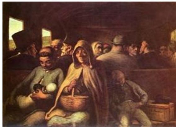
El vagón de tercera clase

Sin embargo al afirmar el carácter burgués de la Revolución industrial, nos estamos olvidando de los trabajadores, quienes aportaron su mano de obra y jornadas extenuantes, en condiciones insalubres e inseguras, a cambio de bajos salarios. Las condiciones de las mujeres y los niños eran peor aún, pues por la misma jornada de trabajo, recibían un salario menor al de los hombres. Si bien es cierto que sobre los trabajadores recayó la peor parte de la industrialización, es decir, salarios de subsistencia y condiciones de trabajo inhumanas y carentes de derechos, no se puede negar que, a la larga, los obreros de los países industrializados, pudieron alcanzar un mejor nivel de vida que en la época preindustrial, gracias a la lucha incesante por mejorar sus condiciones laborales.