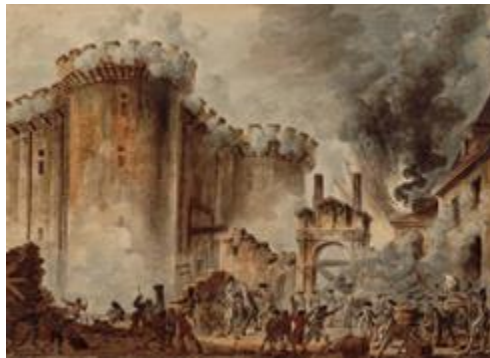
Toma de la Bastilla

Pero no hay que olvidar que la rebelión de las trece colonias que el Reino Unido poseía en el norte de América constituyó la primera revolución de carácter burgués y sentó un precedente, tanto para la Revolución Francesa como para la independencia de las colonias españolas en América.