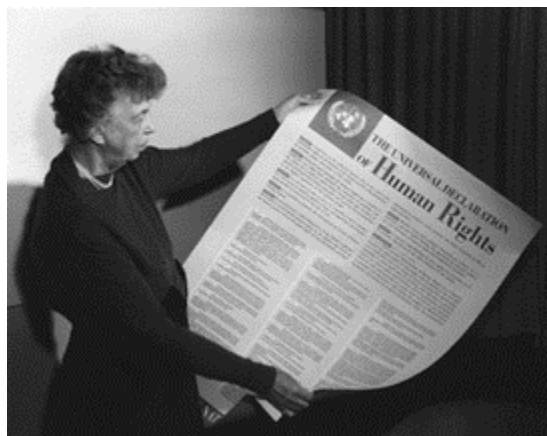
Eleanor Roosevelt sosteniendo poster de la declaración de los Derechos Humanos

El legado de las revoluciones burguesas lo podemos ver en documentos actuales, como la Declaración Universal de los Derechos Humanos, promulgada por la ONU en 1948, en la que los países firmantes se comprometen a defender los derechos humanos de las personas, sin distinción de género.