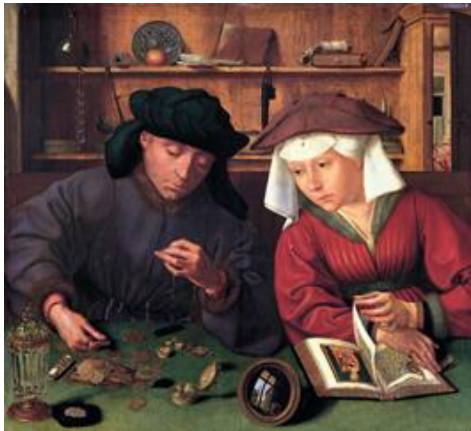
El cambista y su mujer

Para hablar de la burguesía debemos remontarnos a finales de la edad media, cuando la estructura social feudal comienza a modificarse gracias a la expansión y desarrollo de las ciudades medievales y al surgimiento de grupos de comerciantes, banqueros y profesionistas. Poco a poco estos grupos empiezan a lograr mayor rango y autonomía en la sociedad, al dejar de depender de los feudos para realizar sus actividades económicas y, por ende, propician el crecimiento de los barrios o burgos alrededor de los castillos, de allí el surgimiento del término burgués o habitante de los burgos.