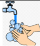
LAVADO DE MANOS

Es el sentido que se extiende a lo largo y ancho de nuestra piel. Con él percibimos características de los objetos como si es duro, si está frío o caliente.